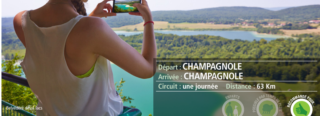
Belvédère des 4 lacs