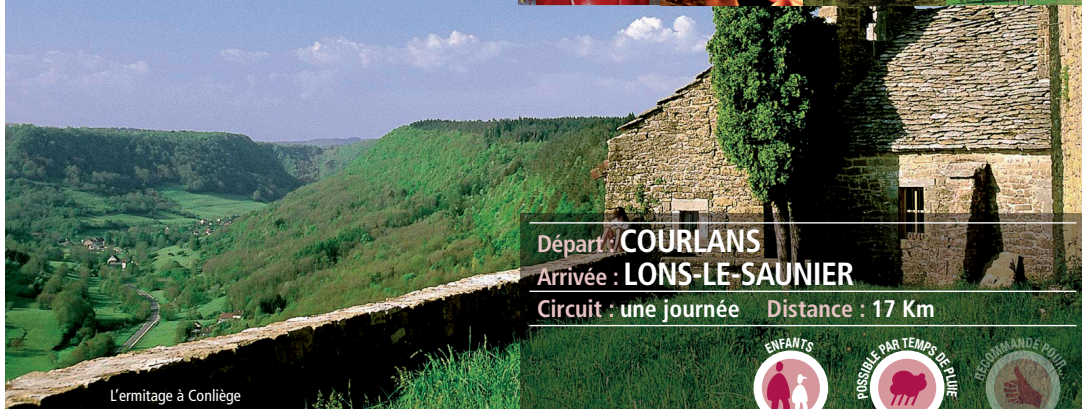
L'ermitage à Conliège

Départ : COURLANS Arrivée : LONS-LE-SAUNIER Circuit : une journée Distance : 17 Km